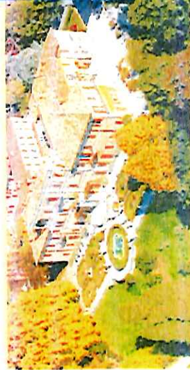
559 metri è il "Pic" della Villa

Le sale moderne della Villa, dotate di ogni comfort, possono accogliere congressi e manifestazioni religiose, scientifiche, culturali, sportive, musicali e artistiche.